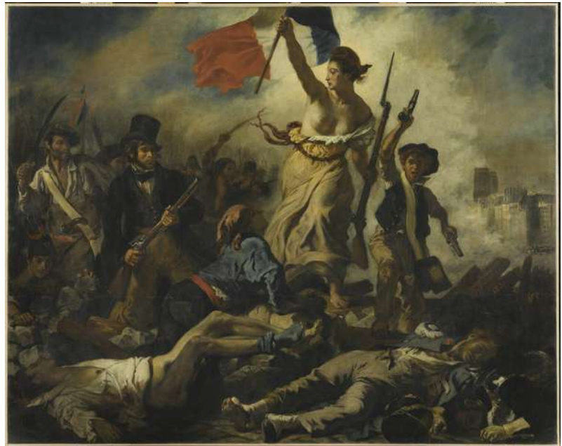
La Liberté guidant le peuple , Eugène Delacroix, 1830. Musée du Louvre

C'est un cri de guerre, un cri de ralliement, qui implique aussi un engagement politique et social . Le romantisme dans les arts résiste à l'emprise de la société et par là même la transforme en profondeur. La Révolution de 1848, qui met à bas le régime monarchique ancré en France depuis des siècles, est en partie le fait d'écrivains romantiques engagés en politique.