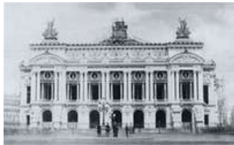
Opéra Garnier (1867, Charles Garnier)