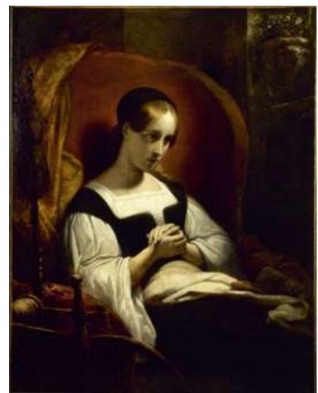
Marguerite au rouet, Ary Scheffer, 1831. Musée de la Vie romantique

La peinture d'Ary Scheffer s'inscrit dans le mouvement romantique à divers égards. Auteur prolifique de portraits, il fait poser Liszt, Chopin, Pauline Viardot et représente Géricault sur son lit de mort. Ses tableaux s'inspirent d'intrigues romanesques, poétiques ou théâtrales : l'histoire tragique et diabolique de Faust et de Marguerite chez Goethe, une sombre histoire de meurtre dans le Manfred de Byron ou encore les amours tragiques de Paolo et Francesca dans la Divine Comédie de Dante. Pour traiter ces sujets, Ary Scheffer utilise la technique du clair-obscur* : des contrastes très forts entre l'ombre et la lumière dans le tableau.