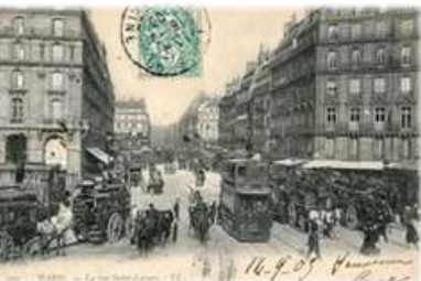
Quartier de la Nouvelle Athènes (1819-1820)