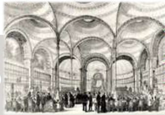
Bibliothèque Nationale (1868, Henri Labrousse)