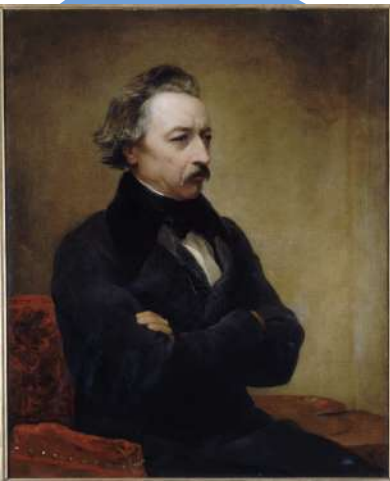
PHILLIPS Thomas (1770-1845). Portrait d'Ary Scheffer.

Ary Scheffer (1795, Dordrecht-1858, Argenteuil)