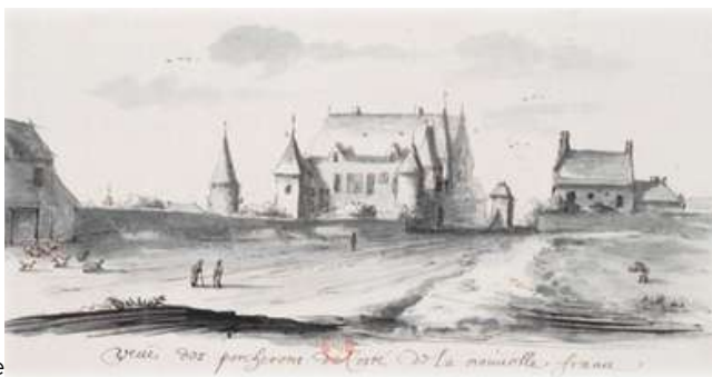
Le château des Porcherons, XVIIe siècle

Appelé « quartier des Porcherons » jusqu'à la fin de l'Ancien Régime en raison du nom d'une famille de riches bourgeois qui y habitait, il change radicalement dans les années 1820.