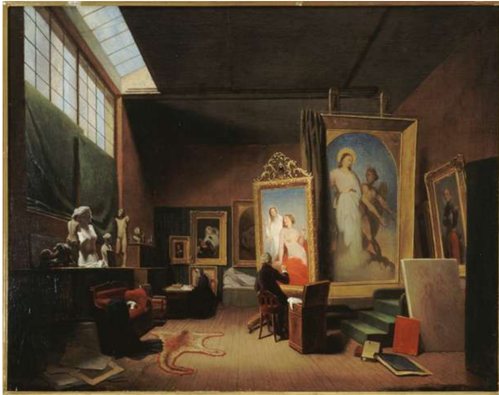
Atelier d'Ary Scheffer, Arie Johannes Lamme, 1851. Musée de la Vie romantique

Le romantisme remet également au goût du jour le Moyen-Âge , en réaction au classicisme qui l'avait condamné. Apparaît la peinture dite « troubadour » dont les scènes représentées et le style correspondent à ce goût « gothique » dont la connotation cesse d'être péjorative. La princesse Marie d'Orléans , fille du roi Louis-Philippe et élève d'Ary Scheffer, excelle dans ce style.