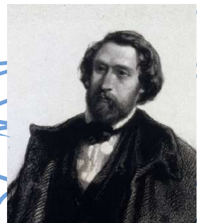
Hippolyte GAVARNI, Alfred de Musset , XIXe siècle, estampe. Musée de la Vie romantique

Au cours de sa vie, Maurice Sand (1823-1889) touche à plusieurs domaines : le dessin (en particulier l'art de la dendrite qu'il apprit aux côtés de sa mère), la peinture, la littérature, la géologie, les sciences, et le théâtre de marionnettes qu'il pratiqua avec passion dans la propriété familiale de Nohant.