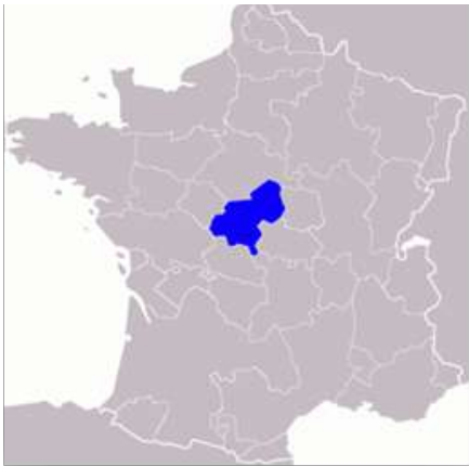
Localisation du Berry

Berry : province française sous l'Ancien Régime correspondant aujourd'hui aux départements de l'Indre et du Cher et dont la ville importante est Bourges.