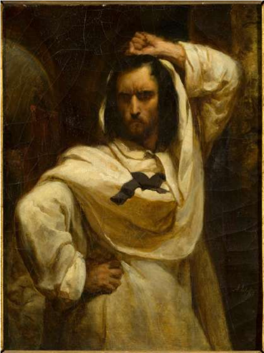
Le Giaour, Ary Scheffer (1795-1858). 1832. D'après Le Giaour de Lord Byron. Musée de la Vie Romantique

Voici deux œuvres qui illustrent le goût orientaliste des peintres romantiques :