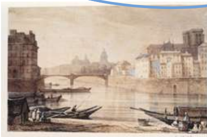
Pont Saint-Louis (1804, troisième version)