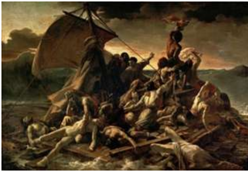
Le Radeau de la Méduse, Théodore Géricault, 1819. Musée du Louvre

Ary Scheffer est originaire de Hollande. Il arrive à Paris en 1811 pour se former dans l'atelier du peintre Guérin, maître d'Eugène Delacroix et de Théodore Géricault. Il se fait suffisamment connaître pour pouvoir en 1822 enseigner le dessin aux enfants du duc d'Orléans, futur roi Louis-Philippe de 1830 à 1848. Grâce à cette activité, le peintre peut se permettre de se loger dans la « nouvelle république des arts et des lettres » : le quartier de la Nouvelle Athènes. Il demande à son propriétaire de lui faire construire à côté de sa demeure deux ateliers, l'un pour recevoir, l'autre pour travailler.