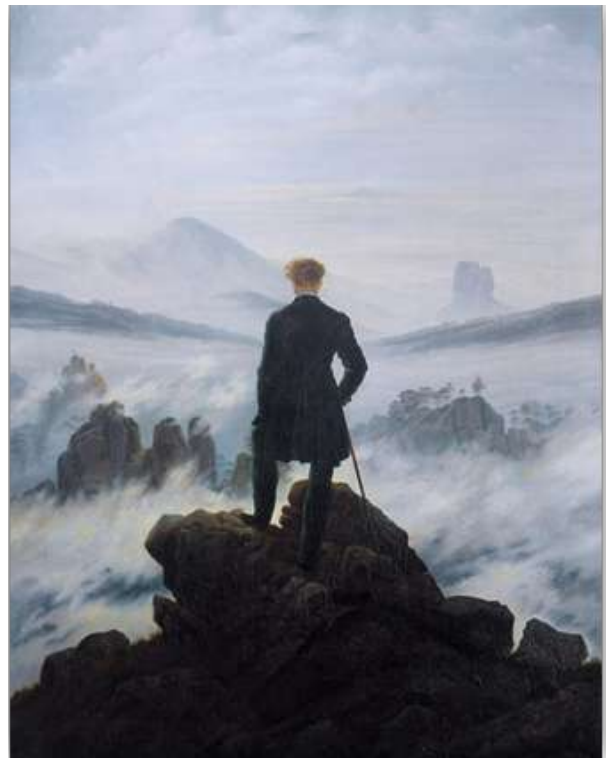
Le Voyageur contemplant une mer de nuages par Caspar David Friedrich, 1818, Kunsthalle de Hambourg

Héros romantique : un stéréotype qu'on retrouve peu ou prou dans toutes les œuvres romantiques ; un jeune homme au costume sombre et élégant, appuyé à une pierre tombale, dans un cimetière, sous la lune, ou debout face à la Nature, contemplant les éléments déchaînés.