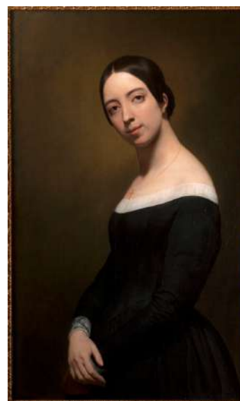
Pauline García, épouse Viardot (1821-1910), mezzo-soprano et compositrice française, Ary Scheffer (1795-1858). Musée de la Vie Romantique

À l'occasion du bicentenaire de la naissance de Pauline Viardot , le musée de la Vie romantique propose du 6 juillet 2021 au 4 septembre 2022 un accrochage d'une quinzaine d'œuvres choisies au sein des collections. Cette sélection de peintures, dessins, partitions et photographies rend hommage à la pianiste virtuose et cantatrice à la voix exceptionnelle que fut Pauline Viardot. Élève de Franz Liszt, amie d'Ary Scheffer, de George Sand et de Frédéric Chopin, elle encouragea tout au long de sa carrière les jeunes talents comme Charles Gounod, Georges Bizet, Camille Saint-Saëns et Gabriel Fauré. Le musée s'attache ainsi à mettre en valeur son activité de compositrice et de pédagogue et invite à redécouvrir l'admiration qu'elle suscitait de son vivant.