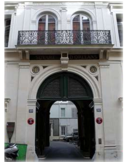
Entrée du square d'Orléans, 80 rue Taitbout, Paris 9e arrondissement

Au rez-de-chaussée du musée, trois salles sont exclusivement consacrées à George Sand. Le but est de retracer l'histoire de cette artiste, en reproduisant les lieux où elle a vécu et en exposant ses dessins, les portraits de ses familiers, le mobilier et les bijoux qui lui appartenaient. Beaucoup d'objets sont liés à Nohant , une belle demeure dans le Berry, où George a passé son enfance et aimait se retirer, loin de Paris.