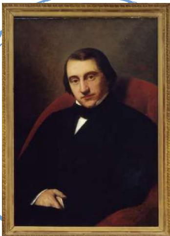
SCHEFFER Henry (1798-1862). Ernest Renan, 1860.

Ernest Renan (1823, Tréguier - 1892, Paris)