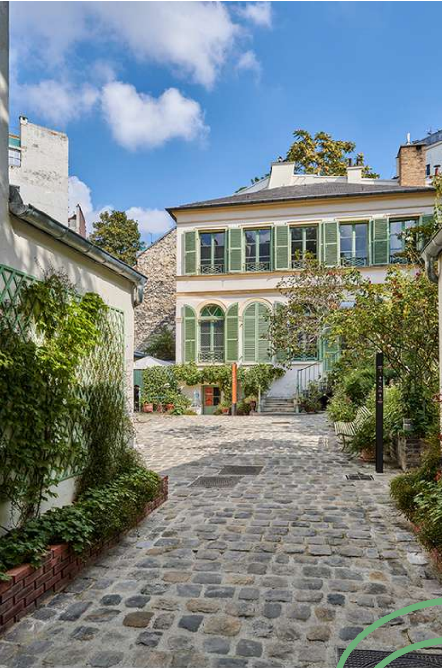
© Pierre Antoine © Pierre Antoine