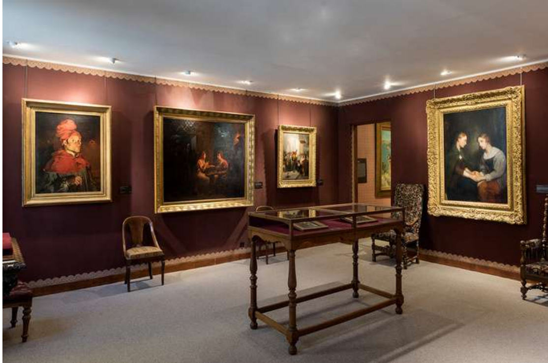
La salle des inspirations littéraires

Les peintres romantiques s'inspirent des romanciers, poètes et dramaturges de leur époque, ou ressuscitent ceux du passé (comme Shakespeare). Tous les tableaux exposés dans cette pièce sont des illustrations de ces histoires grandioses ou tragiques.