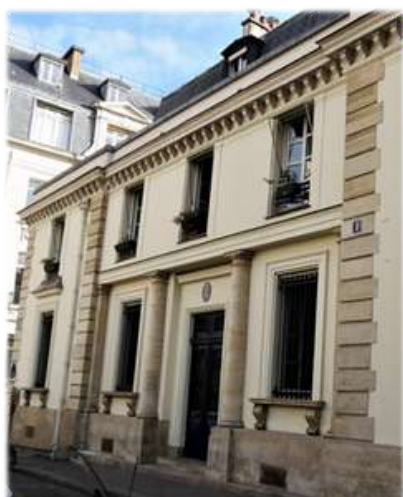
Hôtel de Mlle Mars, rue de la Tour-des-Dames

Édifiés dans un style néo-classique* , ces nouveaux hôtels témoignent du philhellénisme* de l'époque. Ce goût pour la Grèce antique, conjugué à l'attrait qu'exerce sur les artistes ce nouveau faubourg*, lui donne alors son nom, la « Nouvelle Athènes ». Centré autour de la rue de la Tour des Dames, le quartier est délimité par la rue Blanche, la rue des Martyrs et la rue Saint Lazare.