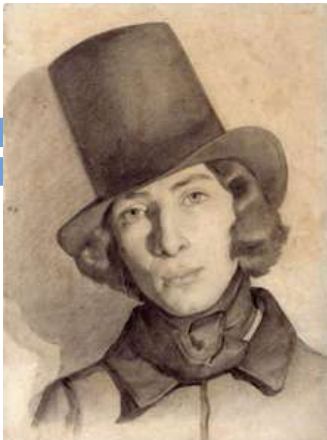
Thomas COUTURE, Portrait de Maurice Sand , XIXe siècle, fusain. Musée de la Vie romantique

George Sand (1804, Paris - 1876 Nohant-Vic), est une romancière, dramaturge, épistolière, critique littéraire et journaliste française. Elle compte parmi les écrivains les plus prolifiques, avec plus de 70 romans à son actif et 50 volumes d'œuvres diverses dont des nouvelles, des contes, des pièces de théâtre et des textes politiques.