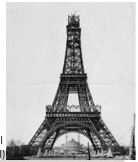
Tour Eiffel (1889, Gustave Eiffel)