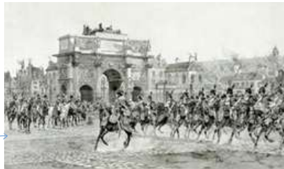
Arc de triomphe du Carrousel (1809, Percier et Fontaine)