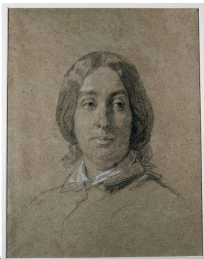
Portrait de George Sand, 1864, Thomas Couture. Musée de la Vie romantique

À sa mort en 1876 , George Sand est connue de tous, et respectée. Victor Hugo lui rend hommage le jour de ses funérailles et invite chacun à faire de même : « Je pleure une morte, et je salue une immortelle. Je l'ai aimée, je l'ai admirée, je l'ai vénérée ; aujourd'hui dans l'auguste sérénité de la mort, je la contemple. Je la félicite parce que ce qu'elle a fait est grand et je la remercie parce que ce qu'elle a fait est bon. ».