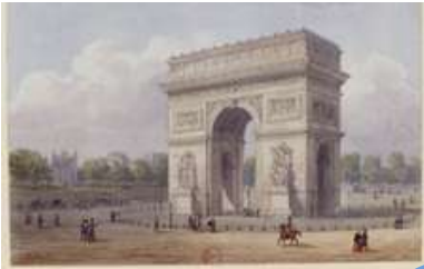
Arc de Triomphe des Champs-Élysées (1836)