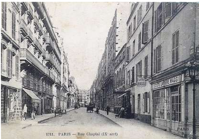
La rue Chaptal au début du XXe siècle

« Quartier nouveau, quartier tranquille s'il en fut et propice aux arts ! peu de bruits, peu de mouvement. Les rues sont bordées çà et là de petits hôtels mystérieux : le commerce n'y ouvre que des magasins de denrées indispensables à la vie » Philippe Burty, 1860