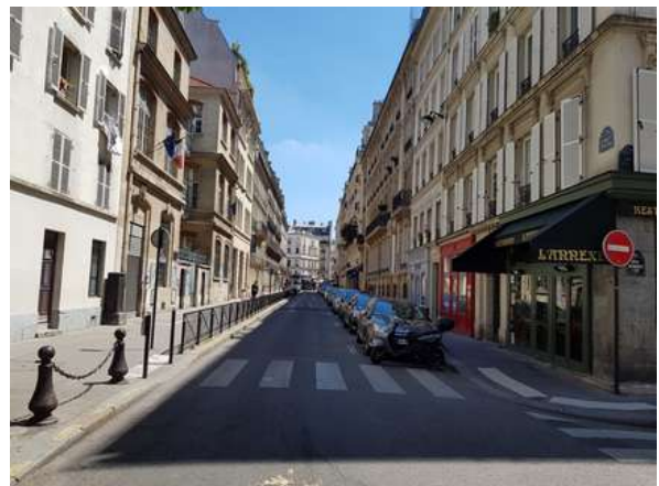
La rue Chaptal aujourd'hui