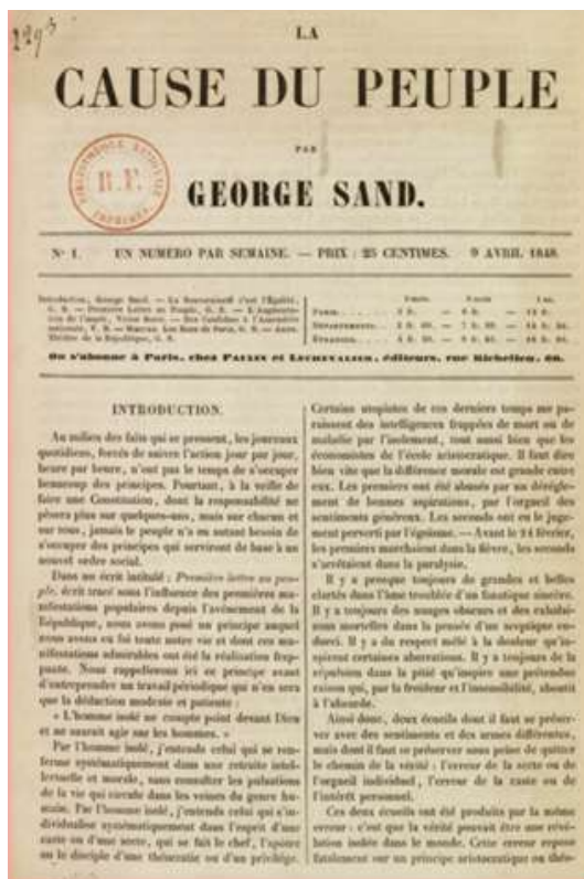
La Cause du Peuple par George Sand, Paulin et Lechevalier éditeurs, 1848, Bibliothèque nationale de France.

Elle n'hésite pas non plus à s'engager politiquement en soutenant les socialistes lors de la Révolution de 1848. Elle écrit des articles et fonde même un journal, La Cause du peuple , où elle prend fait et cause pour les « petites gens » qui n'ont pas la possibilité d'exprimer leurs revendications.