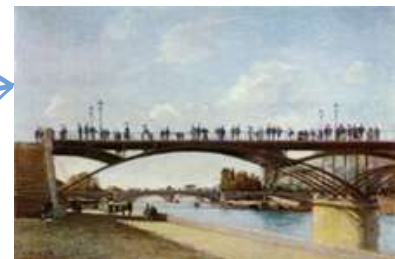
Pont des Arts (1804, première version)