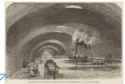
Canal Saint-Martin (inauguré en 1825)