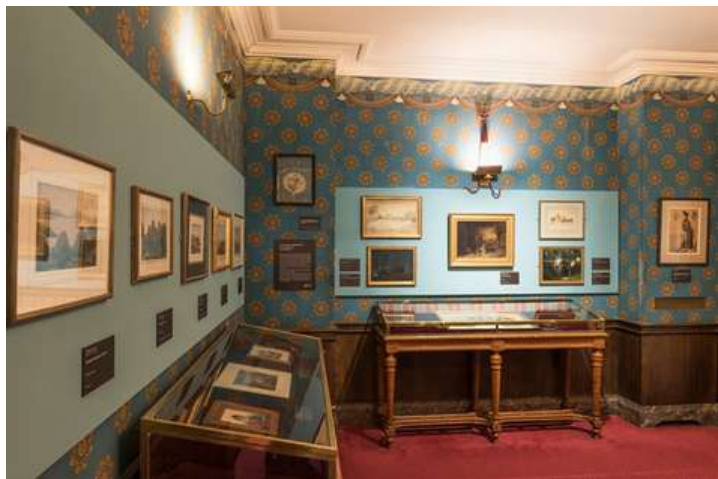
Le petit salon bleu au musée de la Vie romantique