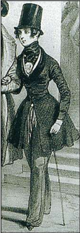
Paul Gavarni, George Sand en costume d'étudiant, 1831, estampe, musée George Sand et de la Vallée noire

Il serait difficile de résumer la personnalité de George Sand en quelques lignes. À l'époque, elle fait scandale parce qu'elle s'habille et agit comme un homme : elle porte des vêtements masculins (pantalon, gilet, redingote* et chapeau) et fume la pipe.