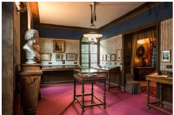
La salle des bijoux

Nous entrons maintenant dans l'univers de George Sand . « Je ne tiens qu'aux choses qui me viennent des êtres que j'ai aimés » disait-elle. Cette salle présente les bijoux qui ont appartenu à la romancière, ainsi que des portraits et d'autres dessins de ses proches et amis .