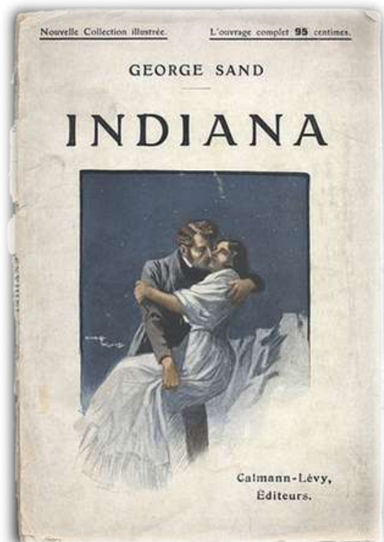
Couverture d' Indiana , Maurice Toussaint, 1910, 20 Calmann-Lévy éditeurs, Nouvelle collection illustrée.

Au sujet d'un de ses livres – Indiana – elle écrit : « j'ai écrit Indiana avec le sentiment (...) de l'injustice et de la barbarie des lois qui régissent encore l'existence de la femme dans le mariage, dans la famille et dans la société. ».