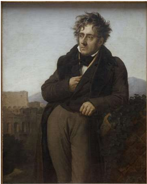
Portrait de Chateaubriand, Giraodet, 1810, musée d'Histoire de la ville de Saint-Malo