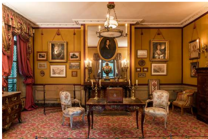
Le salon George Sand

Cette pièce reconstitue le salon de George Sand dans sa maison de campagne à Nohant, dans le Berry*. Le portrait de l'écrivain au-dessus de la cheminée surplombe la pièce. Les portraits de famille et le mobilier proviennent également de Nohant.