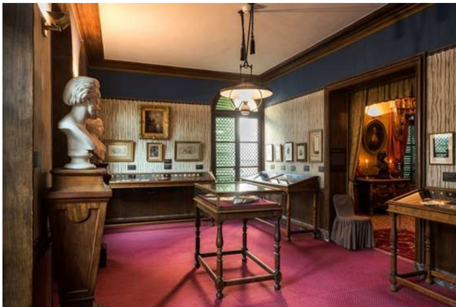
Le cabinet des bijoux au musée de la Vie romantique

Au rez-de-chaussée du musée, trois salles sont exclusivement consacrées à George Sand. Le but est de retracer l'histoire de cette artiste, en reproduisant les lieux où elle a vécu et en exposant ses dessins, les portraits de ses familiers, le mobilier et les bijoux qui lui appartenaient. Beaucoup d'objets sont liés à Nohant , une belle demeure dans le Berry, où George a passé son enfance et aimait se retirer, loin de Paris.