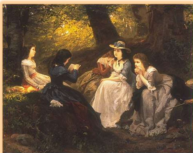
Lecture du Werther de Goethe par Wilhelm Amberg, 1870, Alte Nationalgalerie, Berlin

La naissance de ce mouvement est liée à une nouvelle sensibilité chez les artistes, qui privilégient le cœur à la raison. La Révolution française a entraîné une désillusion face à l'idéal des Lumières – un progrès illimité et une Raison toute puissante. Les artistes se livrent alors à une littérature plus intime , qui met l'avenir en doute et souligne les souffrances personnelles et collectives. L'optimisme conquérant cède la place à un questionnement existentiel .