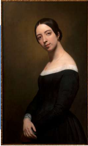
SCHEFFER Ary (1795-1858). Pauline Garcia, épouse Viardot (1821-1910), mezzo-soprano et compositrice française.

Pauline Garcia (1821, Paris - 1910, Paris), connue sous le nom d'épouse Viardot, est une cantatrice (mezzo-soprano) et une compositrice française d'origine espagnole. Elle reprend les rôles de sa soeur, Maria Malibran, après sa mort tragique.