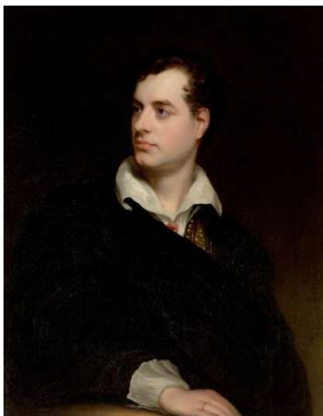
Portrait de lord Byron , Thomas Philips, 1813, Newstead Abbey ©

Cette dimension politique du romantisme peut également être illustrée par l'engagement de Lord Byron , célèbre poète anglais, auprès des révolutionnaires grecs combattant l'empire ottoman. Sa mort brutale à l'âge de trente-six ans émeut les écrivains et les peintres romantiques de toute l'Europe. Byron devient le héros romantique* par excellence, figure de l'Orient tragique, terre où l' idéal de liberté se confronte à la terrible réalité de l'oppression et de la division. Delacroix, Victor Hugo ou encore Ary Scheffer y puisent une inspiration pour leurs œuvres respectives.