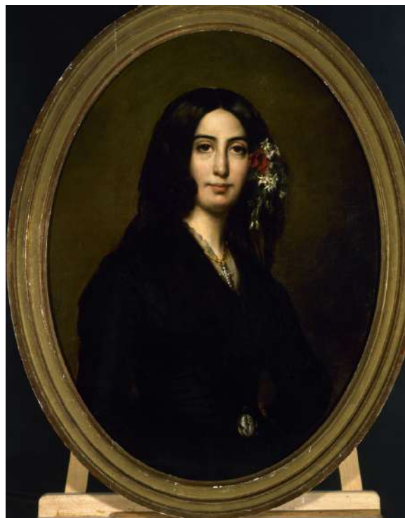
Portrait de George Sand (1804-1876), écrivain français. Auguste Charpentier (1813-1880). vers 1837. Musée de la Vie romantique

D'autres cependant l'admirent, car elle dit tout haut ce que beaucoup de femmes pensent tout bas. Ainsi, l'écrivain Balzac dit de George : « Elle est garçon, elle est artiste, elle est grande, généreuse, dévouée. » tandis que le journaliste et écrivain Sainte-Beuve s'écrie : « Allez, madame ; vous êtes une nature bien rare et forte. ».