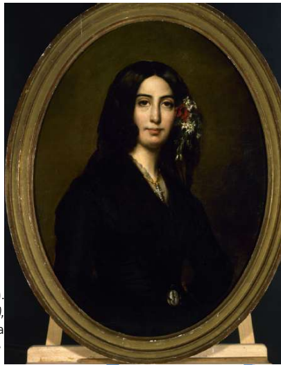
CHARPENTIER Auguste (1813-1880). Portrait de George Sand (1804-1876), écrivain français. vers 1837.

Pauline Garcia (1821, Paris - 1910, Paris), connue sous le nom d'épouse Viardot, est une cantatrice (mezzo-soprano) et une compositrice française d'origine espagnole. Elle reprend les rôles de sa soeur, Maria Malibran, après sa mort tragique.