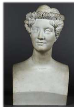
David d'Angers, Mademoiselle Mars (1779-1847), comédienne française, 1825, musée de la Vie romantique, biscuit

Édifiés dans un style néo-classique* , ces nouveaux hôtels témoignent du philhellénisme* de l'époque. Ce goût pour la Grèce antique, conjugué à l'attrait qu'exerce sur les artistes ce nouveau faubourg*, lui donne alors son nom, la « Nouvelle Athènes ». Centré autour de la rue de la Tour des Dames, le quartier est délimité par la rue Blanche, la rue des Martyrs et la rue Saint Lazare.