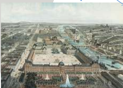
Rue de Rivoli (1804, début du percement)