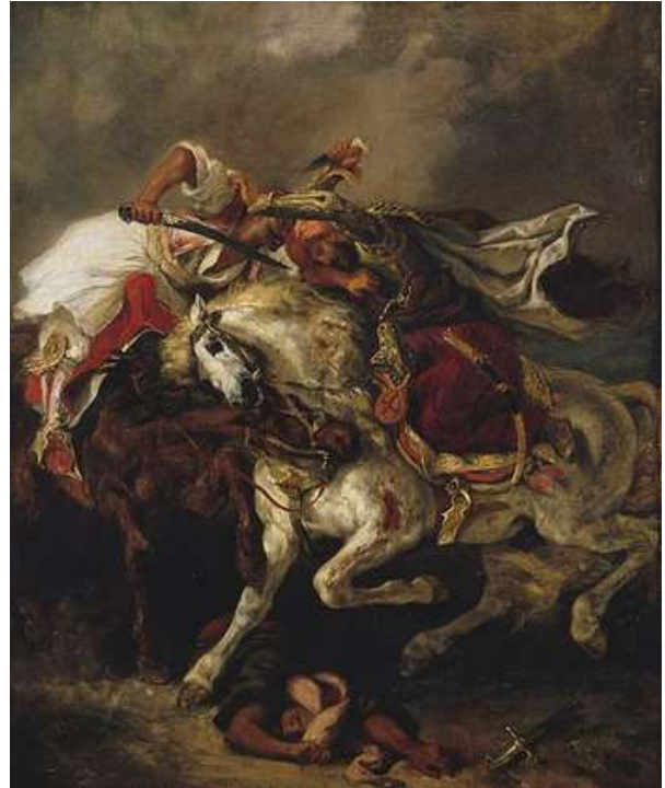
Combat du Giaour et du Pacha , Eugène Delacroix, 1835, Petit Palais

« Giaour » signifie infidèle, c'est un terme méprisant utilisé par les Turcs pour qualifier les Grecs non-musulmans. Ces deux tableaux font directement référence à la guerre d'indépendance grecque contre les Turcs ottomans dans les années 1820.