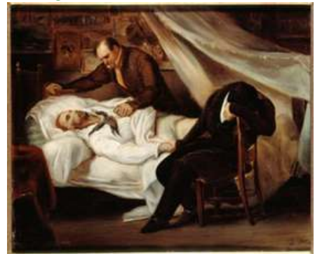
La mort de Géricault, Ary Scheffer, 1824. Musée de la Vie romantique

Ce lieu devient le repère des romantiques du quartier tels Delacroix et Géricault, mais aussi la célèbre cantatrice Pauline Viardot, la comédienne Mademoiselle Mars et la romancière George Sand. D'autres viennent de plus loin pour se retrouver entre pairs, lire et débattre ensemble. On trouve parmi ceux-là les fameux musiciens Chopin et Liszt, Rossini le compositeur d'opéras, ou encore Dickens, l'auteur d' Oliver Twist et de David Copperfield .